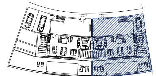
SITUACION POR BLOQUE